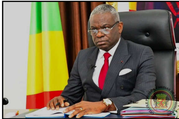
Anatole Collinet Makosso

Au-delà des enjeux politiques, cette reconduction symbolise également une dynamique de confiance entre les institutions et les citoyens. Elle témoigne d'une volonté de consolider les acquis et d'inscrire durablement le Congo sur la voie de la modernisation et de l'émergence. Plus qu'une simple reconduction, c'est donc un nouveau départ qui s'annonce pour le gouvernement Makosso. Une opportunité de transformer les ambitions en réalisations concrètes et de renforcer l'élan vers un avenir prospère pour tous les Congolais. Dès 1998, il avait été nommé conseiller à la présidence de la République avant d'être nommé ministre de la Jeunesse et de